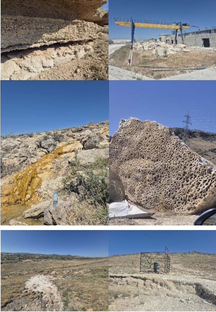
Şekil 2: Çalışma kapsamında incelenen (1) Karadağ, (2) Sarıhıdır, (3) Karadağ, (4) Balkaya-Boztepe, (5-6) Karadağ travertenleridir.