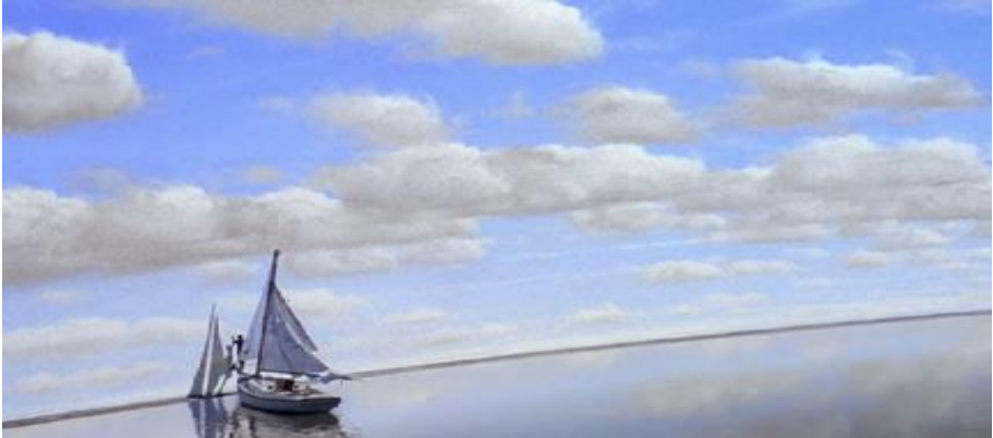
Görsel 1: Truman film setinin duvara çarpma anı.

Christof, Truman'ı şovda tutabilmek amacıyla yapay bir fırtına yaratır ve onu zorla şovun içinde tutmaya çalışır. Deniz ve fırtına korkusu Truman'ı tutsak eden bir metafordan ibarettir. Ancak nihayetinde Truman bu fırtınaya direnir ve yönetmene karşı gelir. Tekne film sahnesinin duvarına çarparak set duvarını deler. Bunu yaşadığı an Truman içinde bulunduğu dünyanın aslında kurmaca olduğunu fark eder. Film setinde ay şeklinde tasvir edilen stüdyoya gizlenen Christof, son kozunu kullanarak Truman'a seslenir. Truman için film setindeki kurgusal hayatın gerçek dünyadan daha iyi olduğunu söyleyerek onu şovda tutmak ister. Ancak Truman ünlü repliğini söyler ve ardından gerçek dünyaya adım atarak özgürlüğünü, kendi yolunu bulmayı seçer.